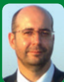
Julio Artiñano Presidente de COGEN España President of COGEN España

We must be able to reach that date when the Energy Transition Law takes effect in 2 or 3 years' time without losing more efficiency. For this we need transition mechanisms, such as holding an auction of at least 1000 MW, scalable to 2,500 MW, always in line with sector requirements, as has already taken place for the remainder of the former "special system", which is no longer so special but rather the reality and the future of the mix of both Spain and Europe.